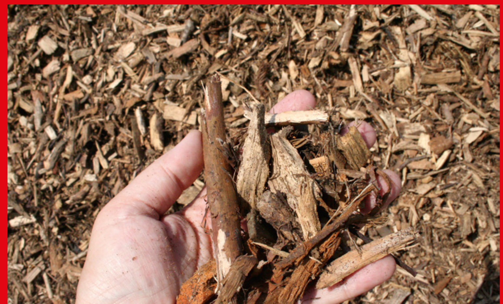
Wüstenrot setzt u.a. auf nachwachsende Rohstoffe zur Deckung des Wärmebedarfs.